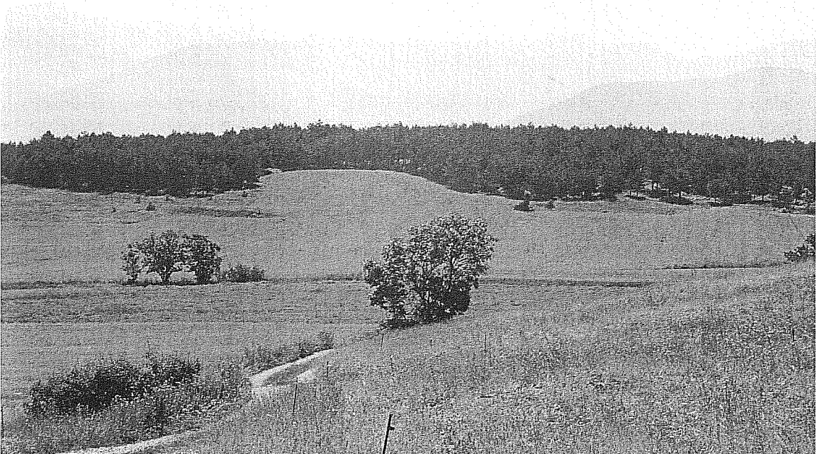
2.- Imatge general dels terrenys