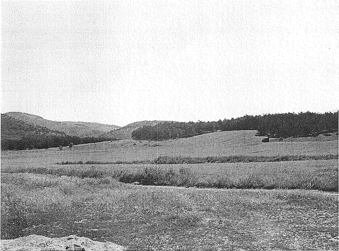
1.- Imatge general dels terrenys